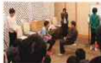
Bad News Tellingに関する ロールプレイ