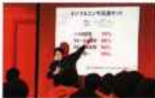
林先生の救急研修に関する講義