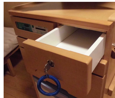
床頭台 セーフティボックス