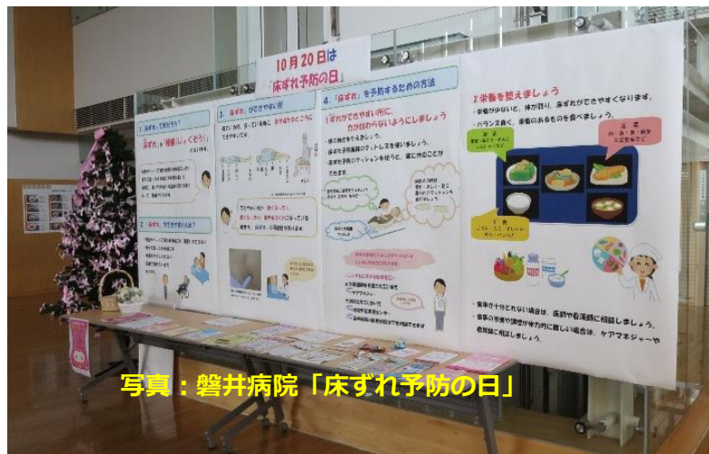
写真：磐井病院「床ずれ予防の日」

1) http://www.jspu.org/jpn/day/day3.html