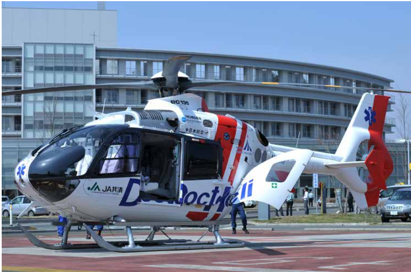
ドクターヘリ活躍中