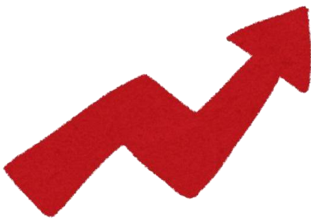
連携ボックス月別利用件数

当院は、必要な情報を医療機関同士が共有できるよりよい仕組みを構築していくため今後も努力を重ねてまいりますのでどうぞよろしくお祈りいたします。